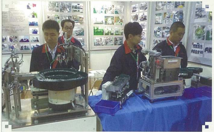
株式会社向陽エンジニアリングのブース(宮城県)