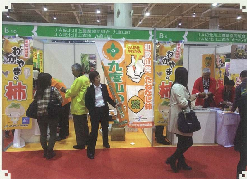
人気のある柿(和歌山県)