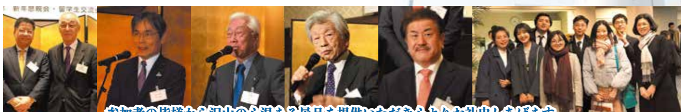
参加者の皆様から沢山の心温まる景品を提供いただき心よりお礼申し上げます。

2月21日(木) 18:00~20:30 会場:福岡サンパレス ホテル&ホール2階パレスルーム 出席者:88名(来賓28名、会員36名、留学生24名)