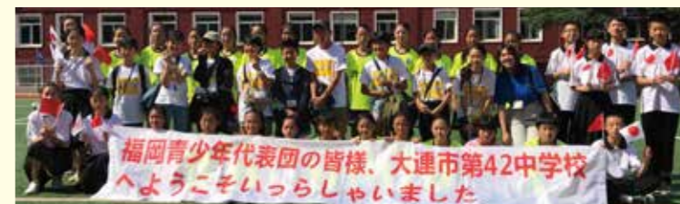
大連市第42中学校の皆さんと