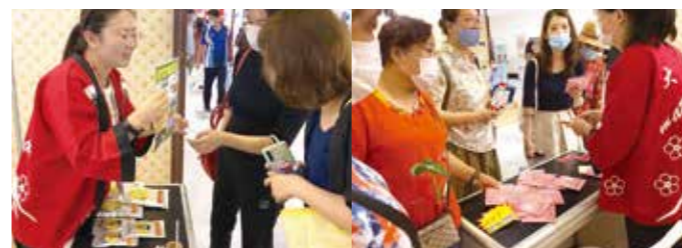
大仁産業(株)(菊芋商品)

今年から遼寧省レベルのイベントとして、「2020中日(大連)博覧会・日本商品展覧会」と名称を変更して開催されました。展示会場は、①日本本土企業、日系企業展示区 ②中国輸出企業展示区 ③中国輸入企業展示区 ④越境電子商取引(EC)展示区 ⑤日本文化ショーの5つのエリアに分かれ、529個の展示ブース(日本商品販売460個、観光案内19個、日本文化案内12個、日本料理販売32個、その他6個)、(山口銀行支援による越境ECを利用した日本商品販売は13社)が設置され、来場者は、約103,000名(前年比3,000名減)でした。