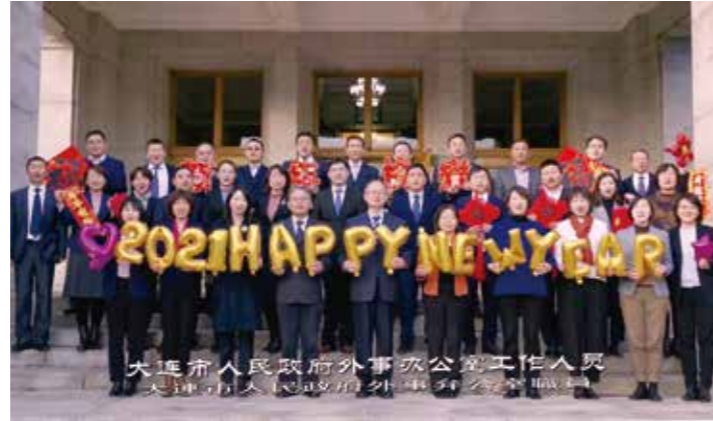
大連市人民政府外事弁公室の皆様

これらの日本関連イベントに関する記事を大連市外事弁公室および大連市対外友好協会から提供していただきましたので、ご紹介します。