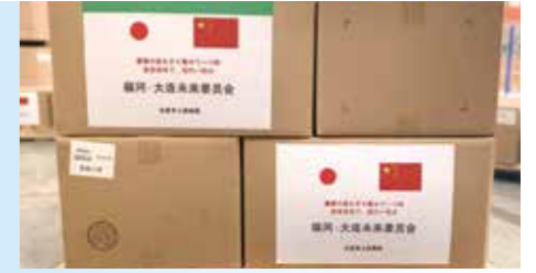
▲大連市から当委員会へ寄贈のマスク

“青山一道同雲雨, 明月何曾是兩鄉”(青山も雲雨も共に見え、異郷から仰ぐ明月も一つ) “瀟瀟春雨下, 相約一把傘”(春雨や身をすり寄せて 一つの傘)