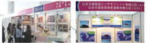
▲大連丸菱貿易有限公司 (パン・丸菱コーヒーアイテム・たこ焼き用ミックス粉他) ▲大連友誼コンテナフレイト有限公司 (物流及び外航海運サービス)

10/21 -22 「2010大連中日貿易投資展示商談会」への協力・協賛・3社出展 会場：大連世界博覧広場 主催：大連市人民政府